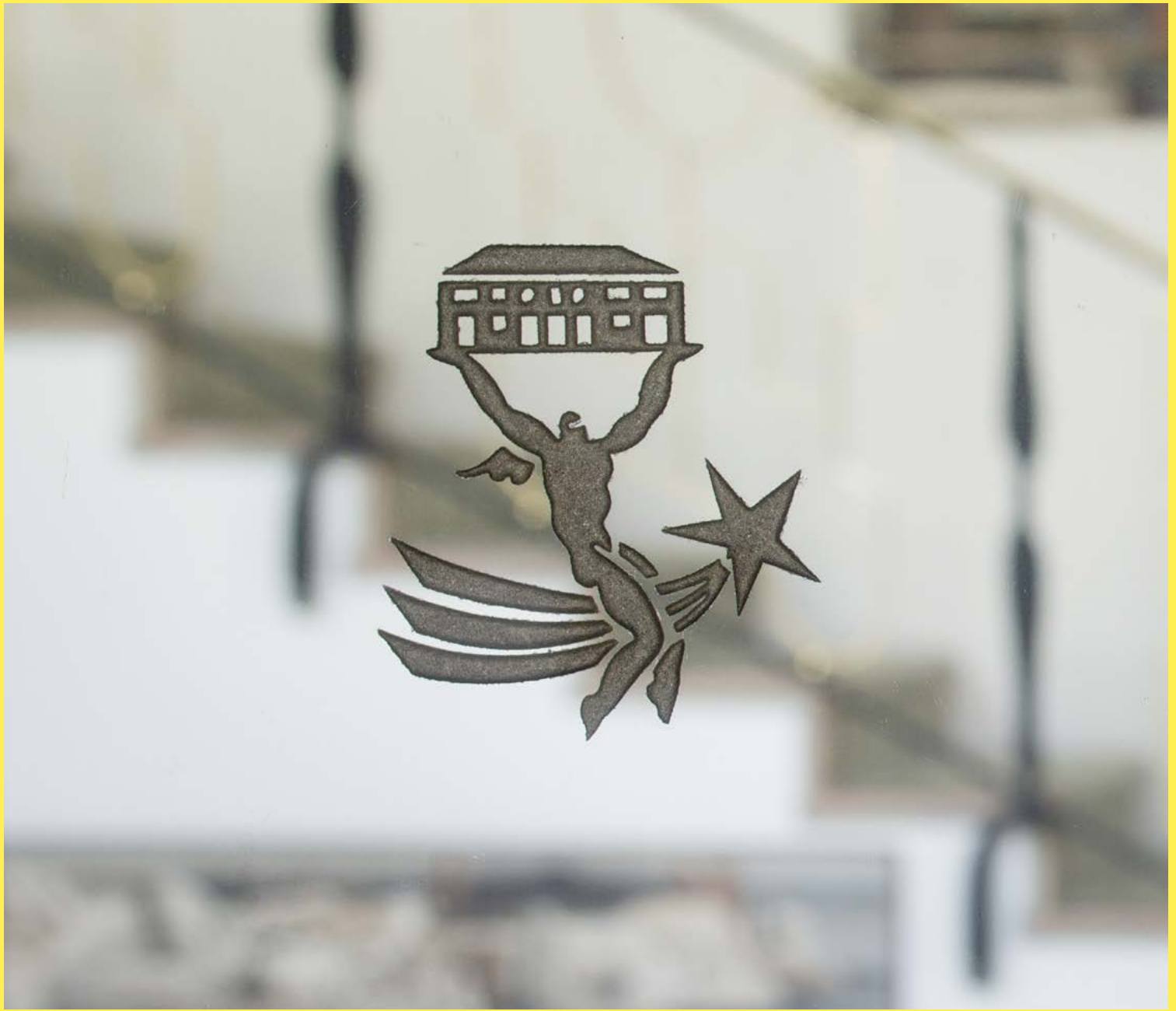
Villa L'Ange Volant, Gio Ponti