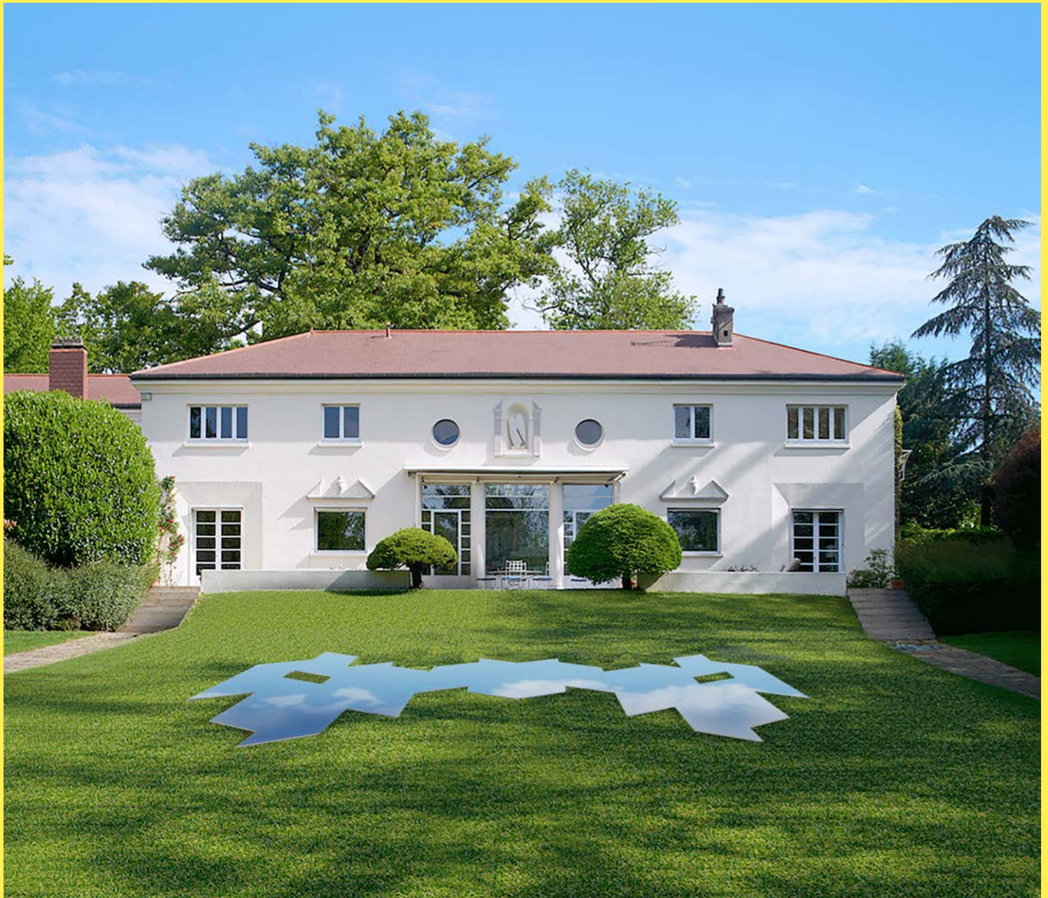
Sans 90 degrés Sky Mirror , Mathias Kiss, 2021 Installation exclusive en miroirs pour Genius Loci à L'Ange Volant. Production Mathias Kiss © Diorama.eu