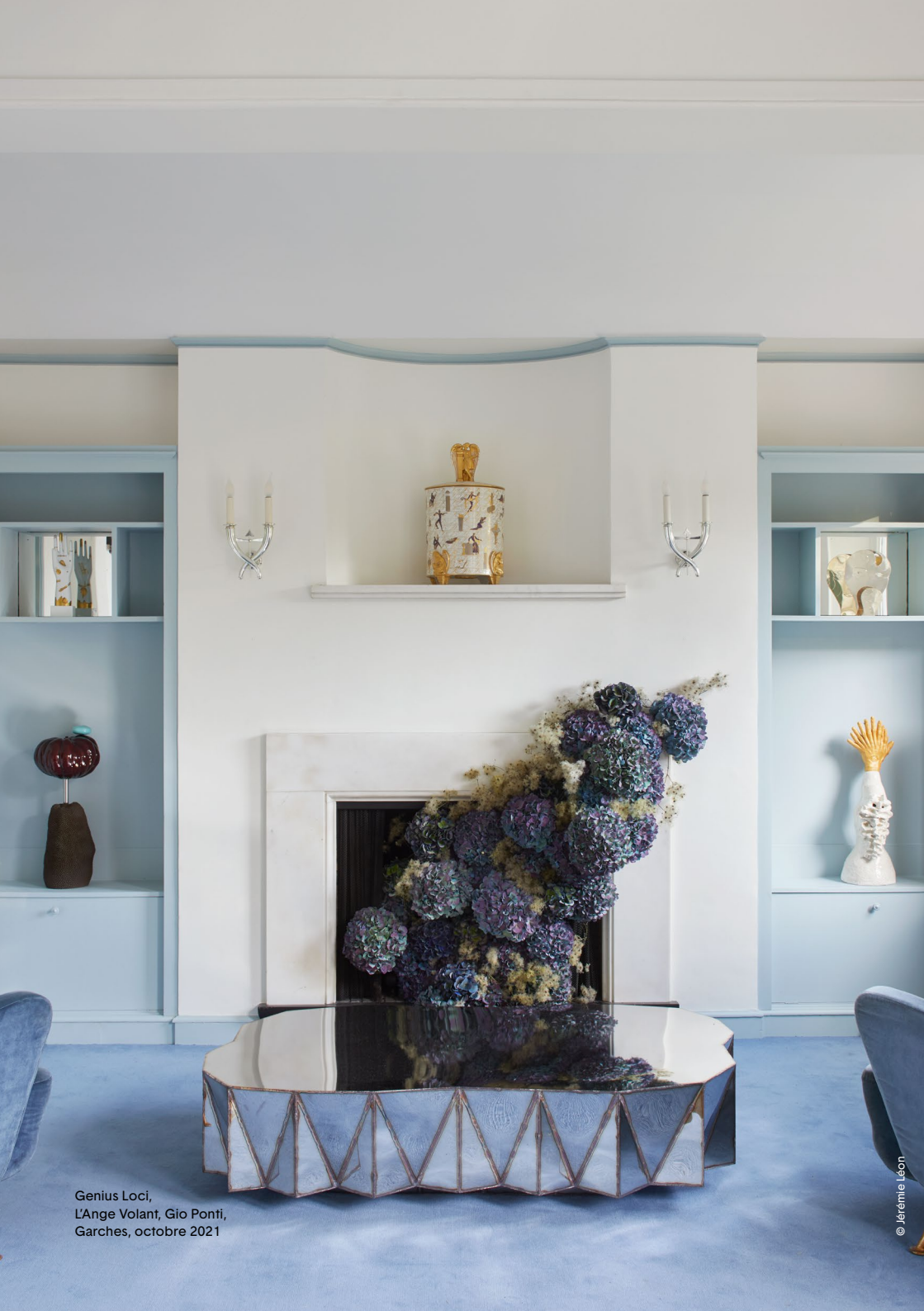
Genius Loci, L'Ange Volant, Gio Ponti, Garches, octobre 2021